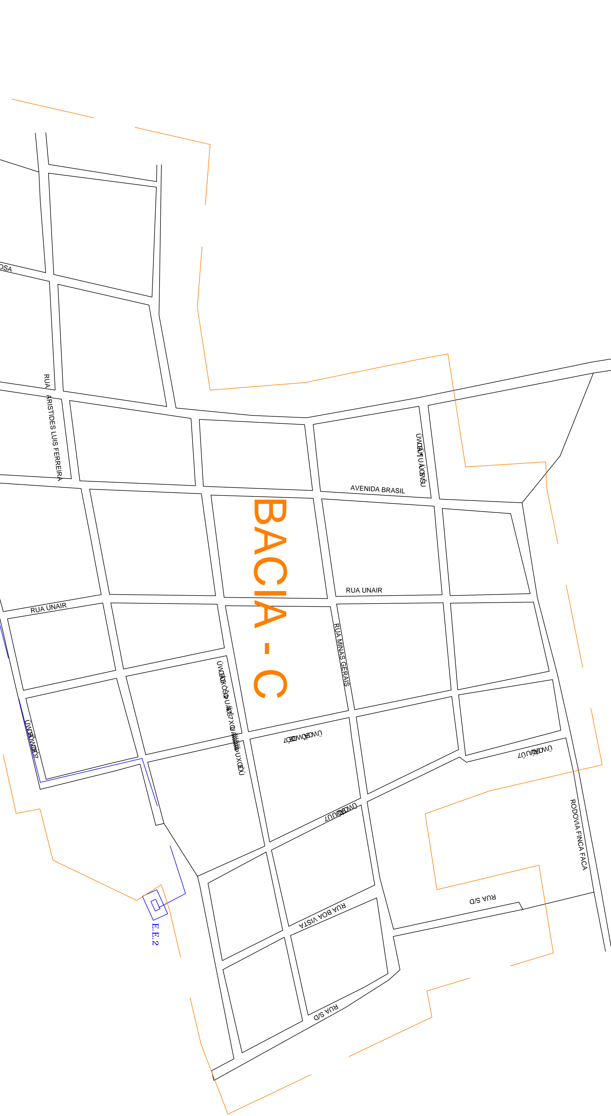
BACIA - C